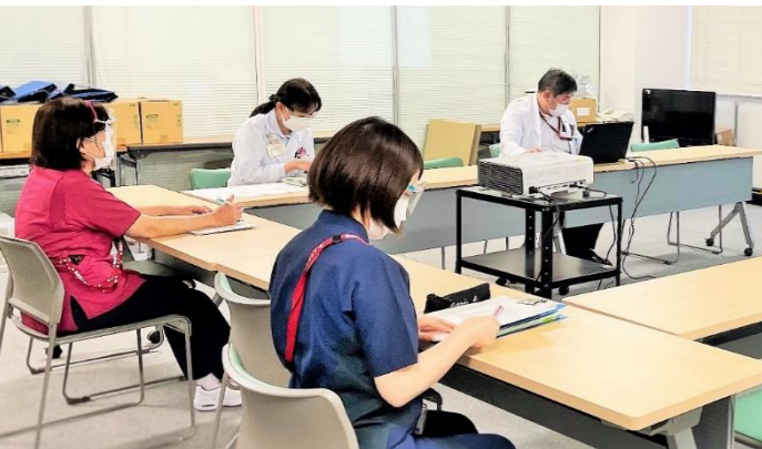
▲緩和ケアチームのミーティングの様子

◆公立甲賀病院では地域内でのがん患者さんに対する治療の強化だけでなく、がんの悪化を防ぐための取り組みや、がん患者さんの家族に対する支援までが、がんに対する様々なことに取り組んでいます！