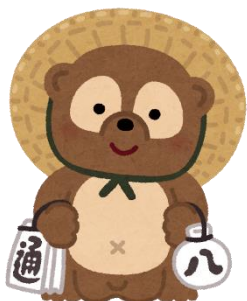
ST4年目 滋賀在住(通勤5分)

夏は琵琶湖をバイクで一周。冬はウインタースポーツ。 登山では琵琶湖をみながら1000m級の山に登ることもでき 気持ちいいです。