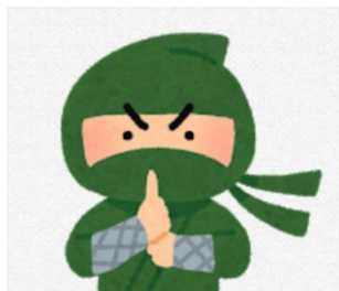
ST6年目 2児の父 京都在住(通勤1時間半)

夏は琵琶湖をバイクで一周。冬はウインタースポーツ。 登山では琵琶湖をみながら1000m級の山に登ることもでき 気持ちいいです。